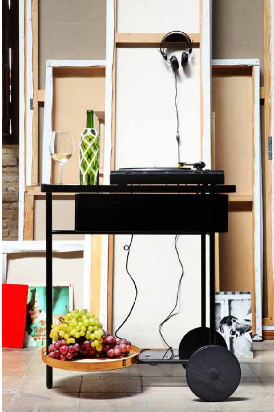
CARRITO DE SERVICIO