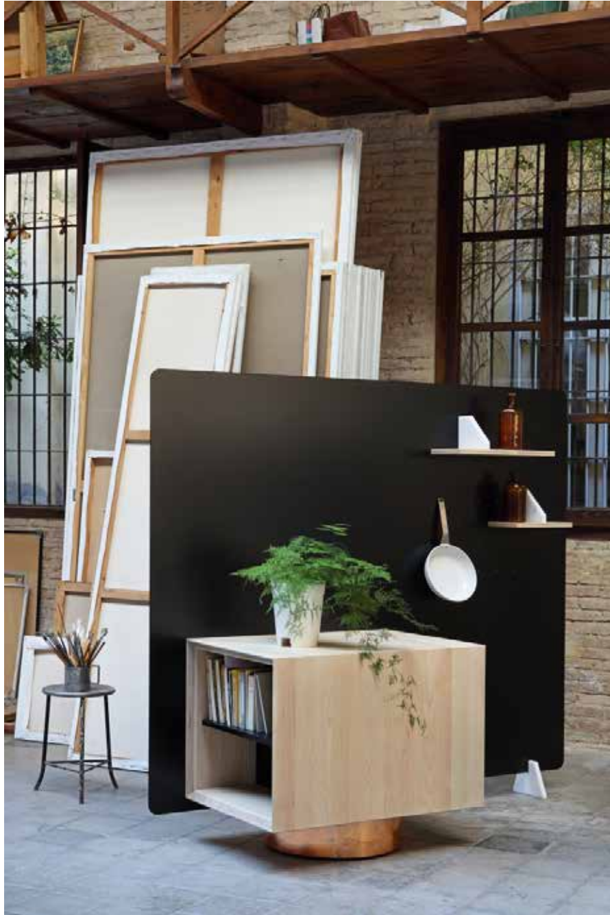
MUEBLE Y PANEL DIVISOR